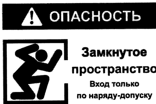
Рекомендуемый знак «ОЗП».

2. Объекты, вошедшие в Перечень 1 и не являющиеся территориально обособленными объектами, должны быть обозначены знаком «ОЗП» (рекомендуемый текст).