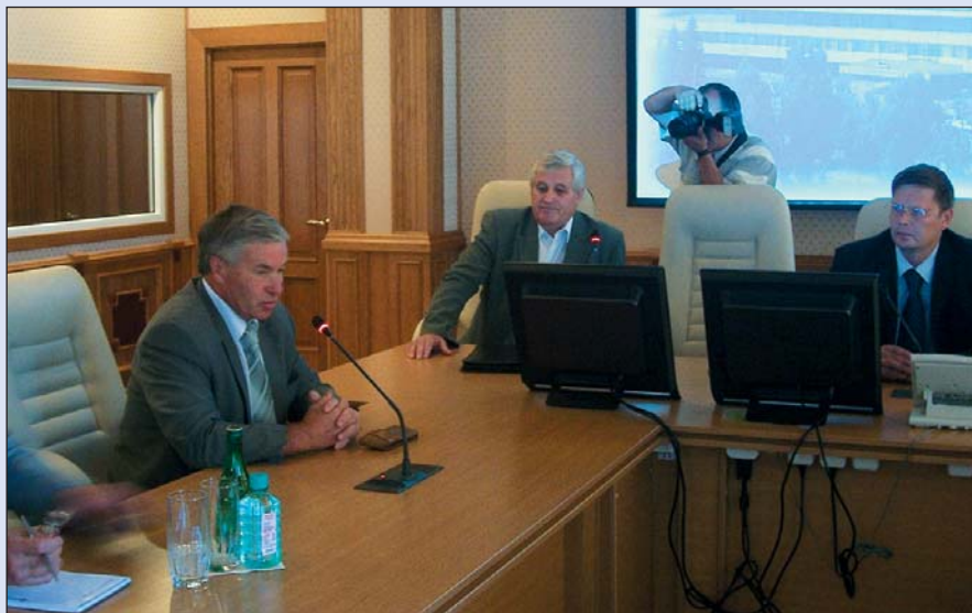
Участники семинара посетили ОАО «УМПО», где встретились с генеральным директором УМПО