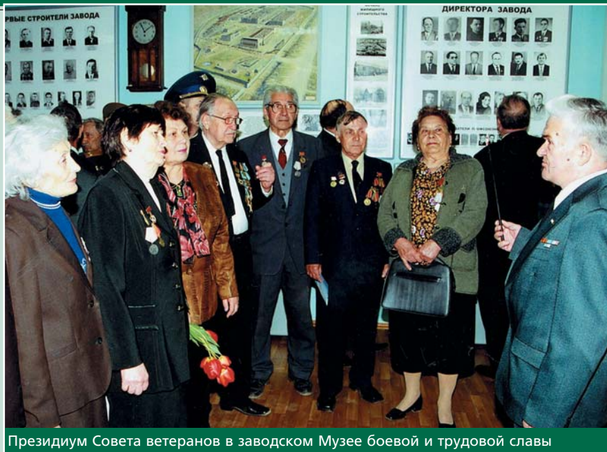
Президиум Совета ветеранов в заводском Музее боевой и трудовой славы

При проведении празднования 61-й годовщины Победы всем ветеранам была оказана материальная помощь: