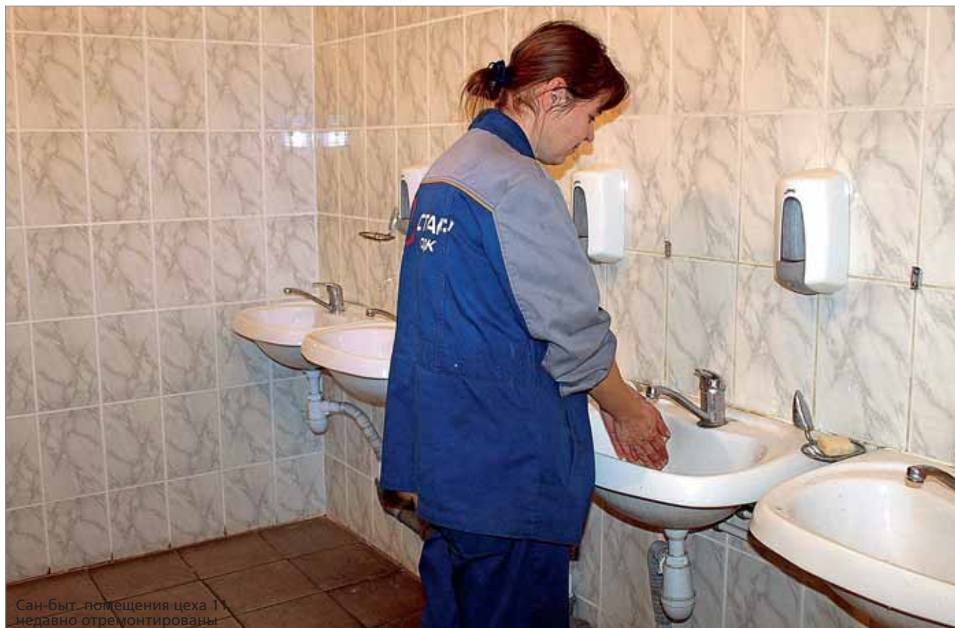
Сан-быт помещения цеха 1 недавно отремонтированы