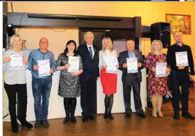
• Верхняя Салда