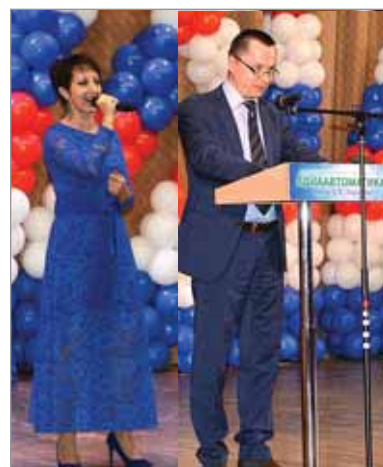
● Белая Калитва