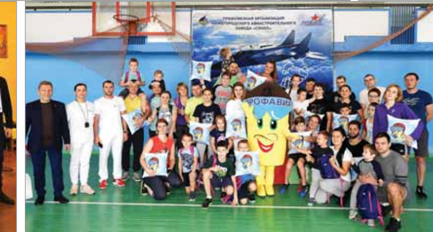
● Нижний Новгород